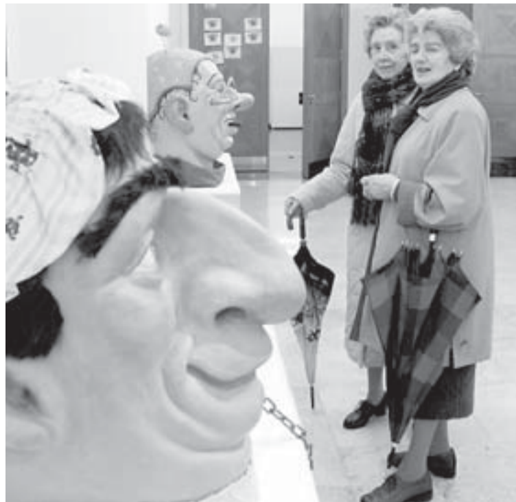
Varias personas visitan la exposición de Carnaval dedicada la figura de Zanpantzar, en el Centro Cultural Amaia.