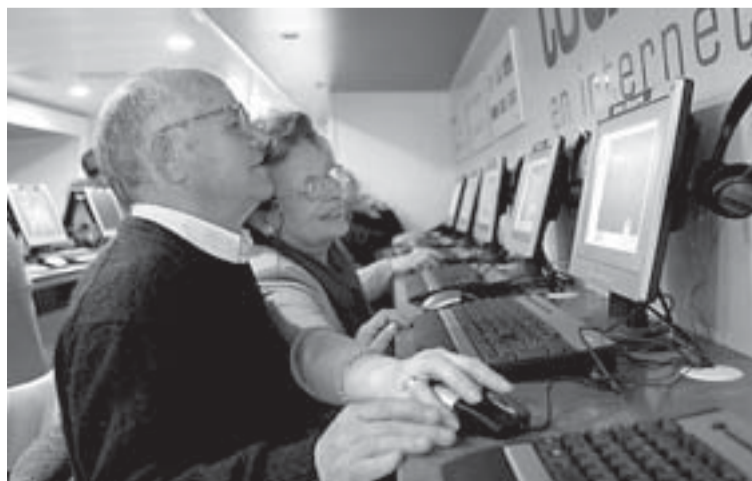
La iniciativa está dirigida a todos los ciudadanos. [F. DE LA HERA]

La iniciativa ya visitó la ciudad en enero con un aula móvil en forma de autobús en la plaza Jenaro